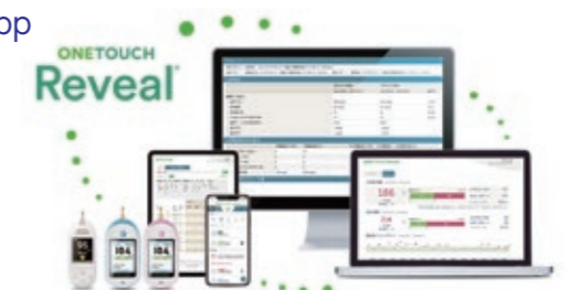
OneTouch Reveal® モバイルアプリ/ウェブアプリ