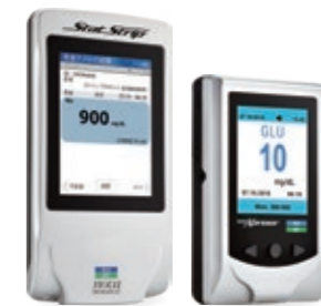
スタートストリップグルコースケトン (左) スタートストリップエクスプレスグルコースケトン (右)