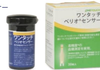
ワンタッチベリオ®センサー