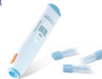
ワンタッチアクロ® (左)・アクロ®ランセット (右)